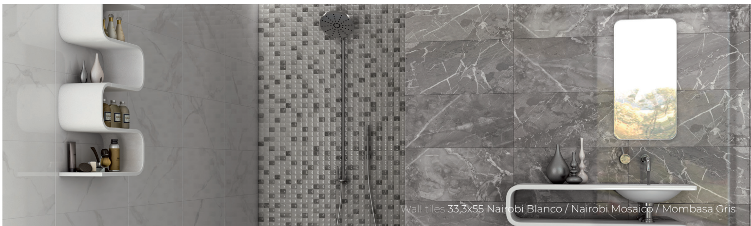
Wall tiles 33,3x55 Nairobi Blanco / Nairobi Mosaico / Mombasa Gris