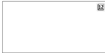
60x120 / 24"x48"

* Diseños de mallas disponibles pág. 558 Available mosaics design pag. 558