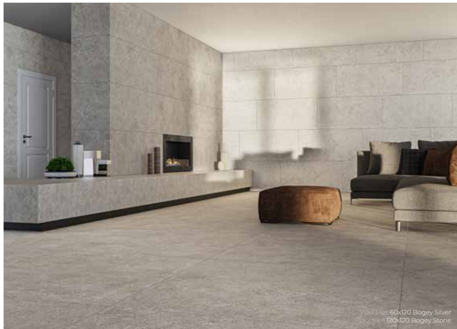
Wall Tiles 60x120 Bogey Silver Floor tiles 120x120 Bogey Stone