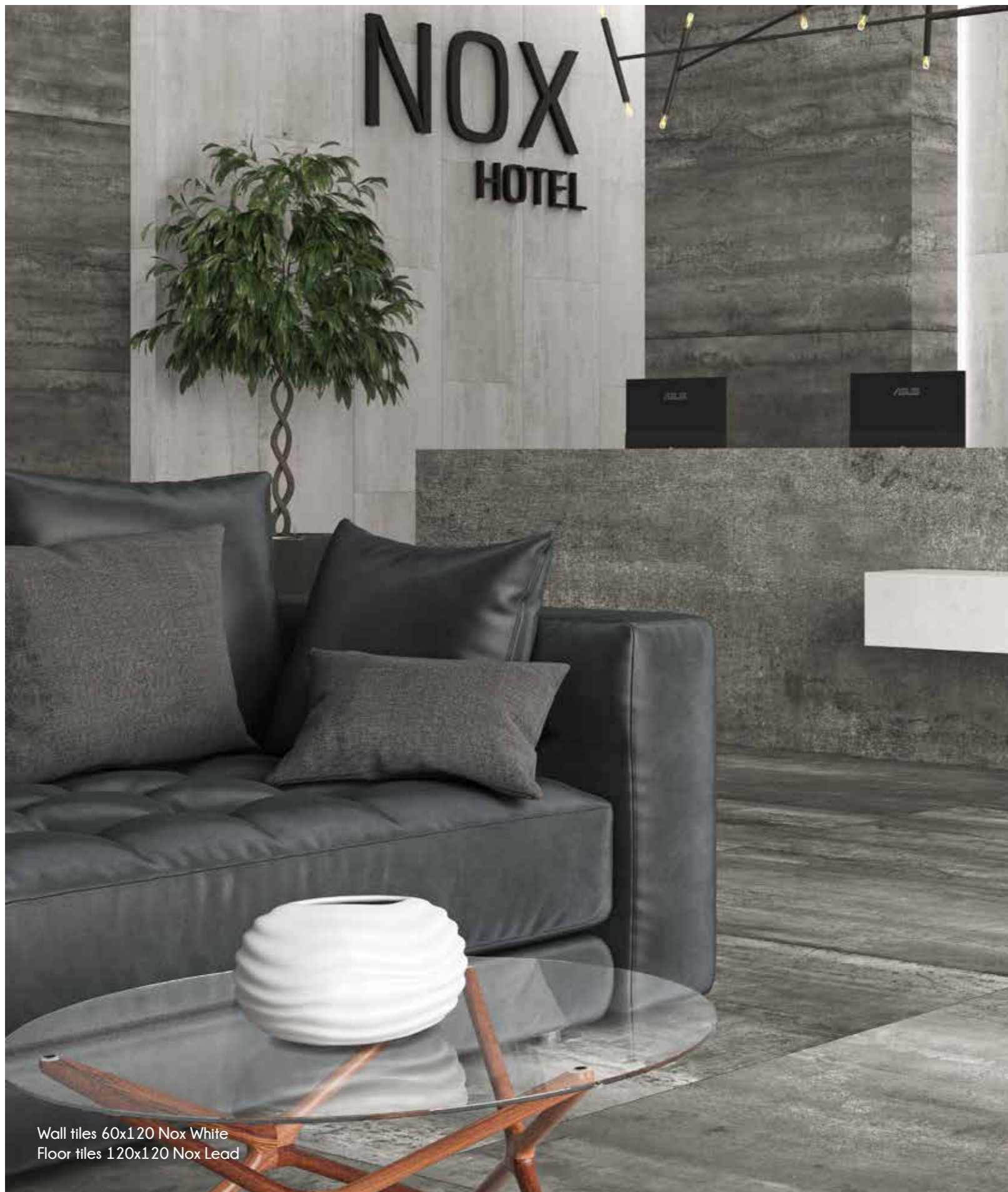
Wall tiles 60x120 Nox White Floor tiles 120x120 Nox Lead