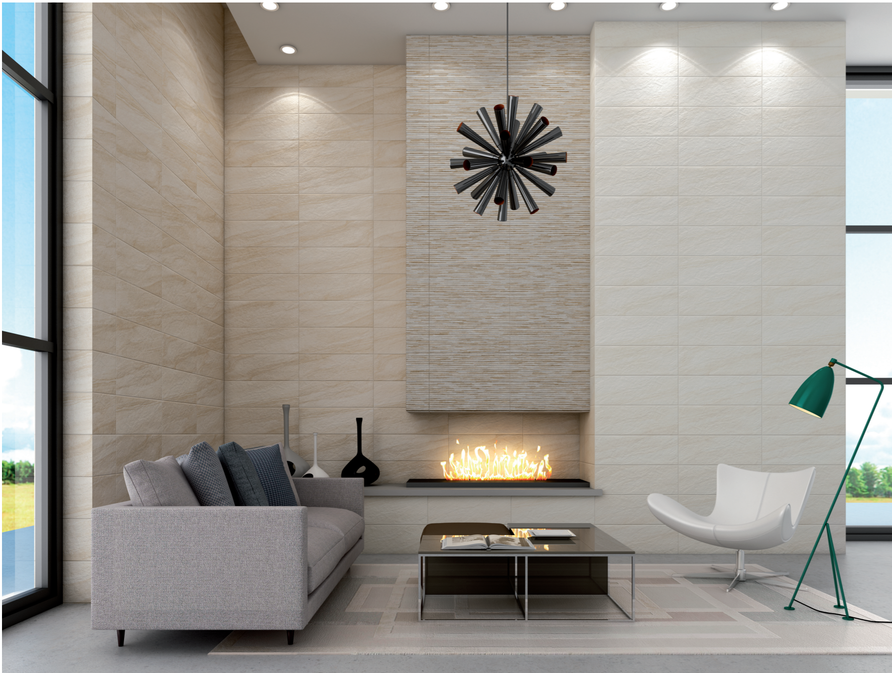
Caliza Crema| Taupe| Rlv. Crema