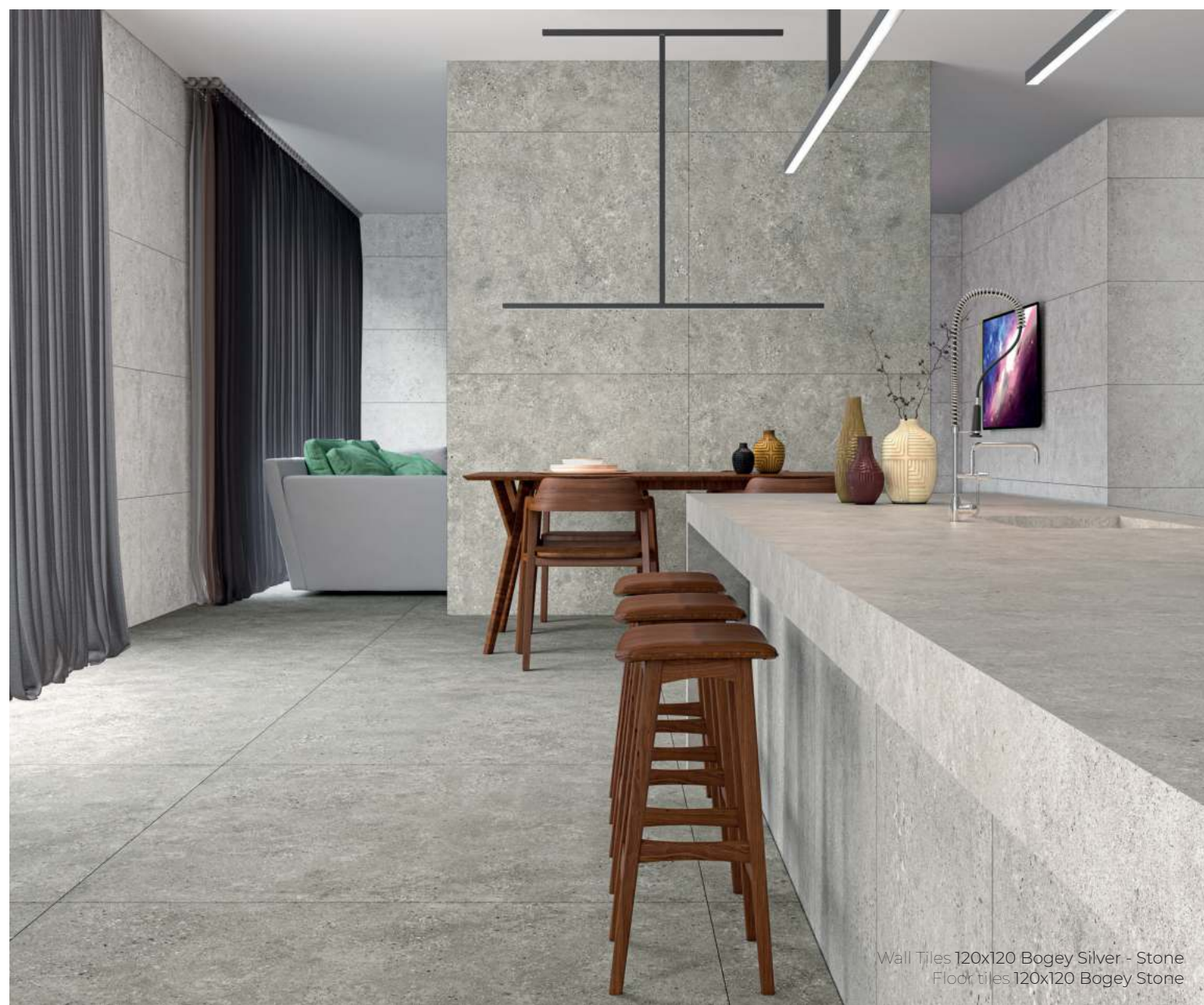
Wall Tiles 120x120 Bogey Silver - Stone Floor tiles 120x120 Bogey Stone