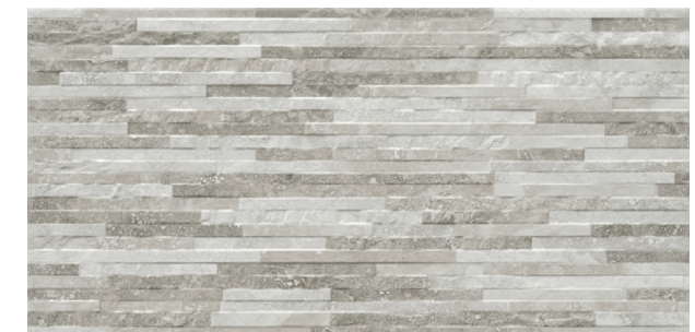
Rlv. Cipriani Mix Gris