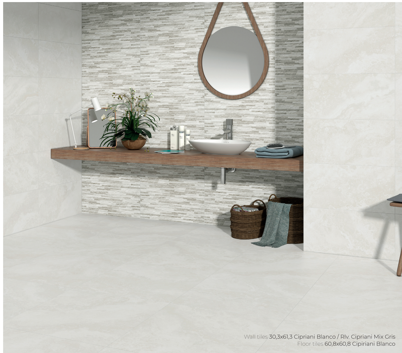
Wall tiles 30,3x61,3 Cipriani Blanco / Rlv. Cipriani Mix Gris Floor tiles 60,8x60,8 Cipriani Blanco