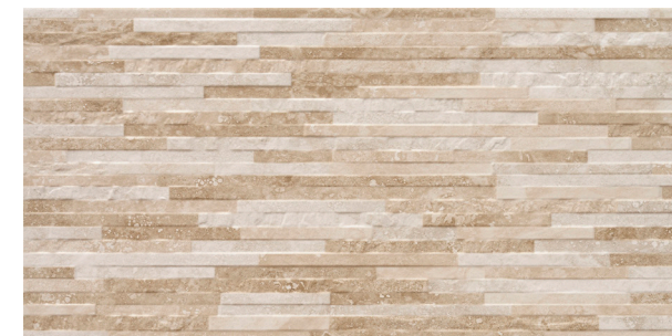
Rlv. Cipriani Mix Beige