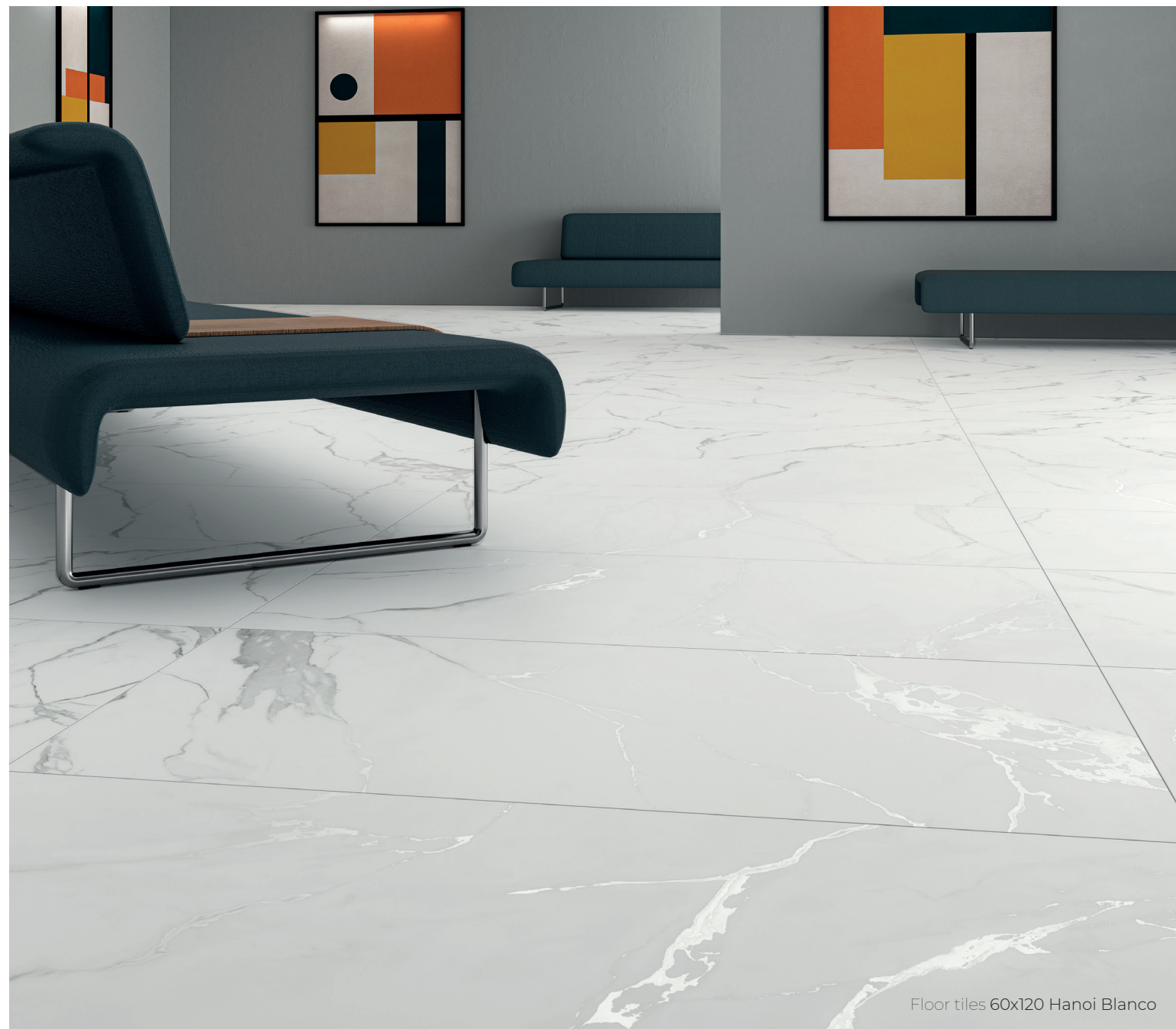
Floor tiles 60x120 Hanoi Blanco