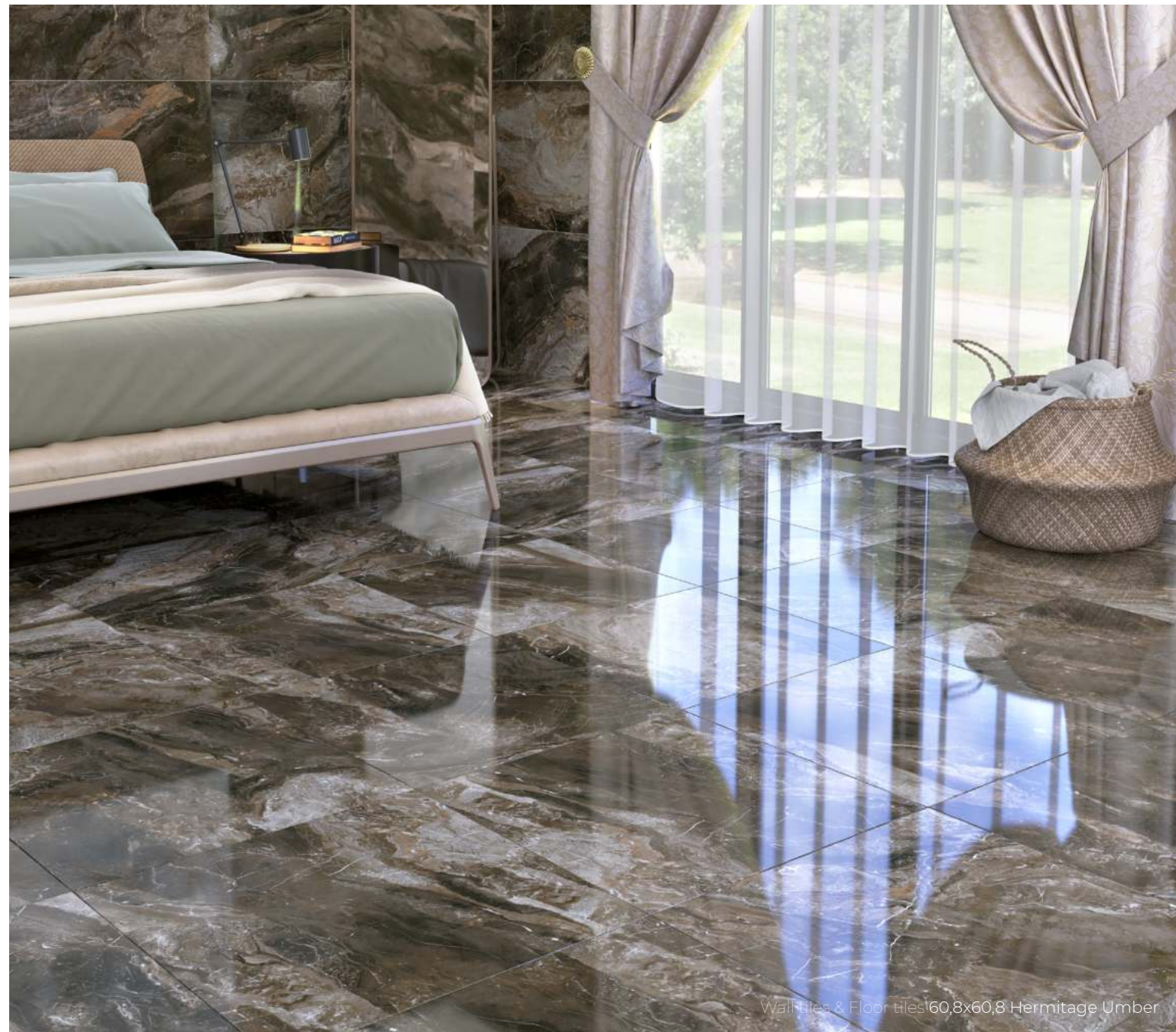
Wall Tiles & Floor Tiles 60,8x60,8 Hermitage Umber