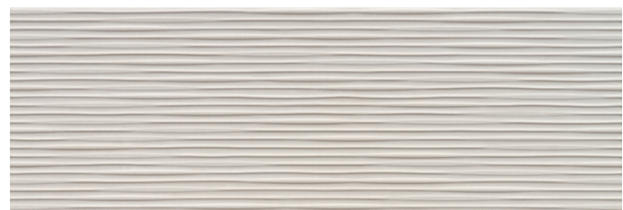
Rlv. Midtown Marfil