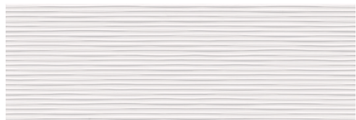
Rlv. Midtown Blanco