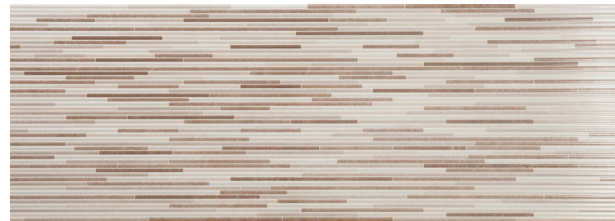
Rlv. Shadyside Crema