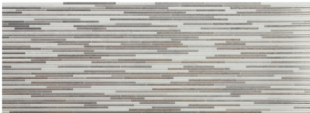
Rlv. Shadyside Perla